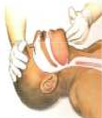
Abra la vía aérea