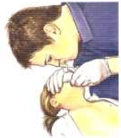
Administre 2 respiraciones

Si la víctima no tiene pulso o la frecuencia cardíaca es menor de 60 latidos por minuto con signos de mala perfusión, inicie ciclos de 30 compresiones y 2 respiraciones: