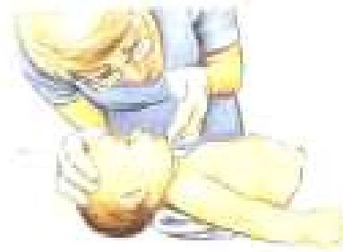
Abra la vía aérea, verifique la respiración