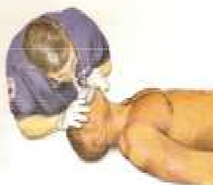
Administre 2 respiraciones

En caso de que la víctima no tenga pulso, inicie ciclos de 30 compresiones y 2 respiraciones: