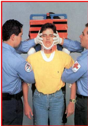
Tabla Larga – Paciente Parado Descenso del paciente